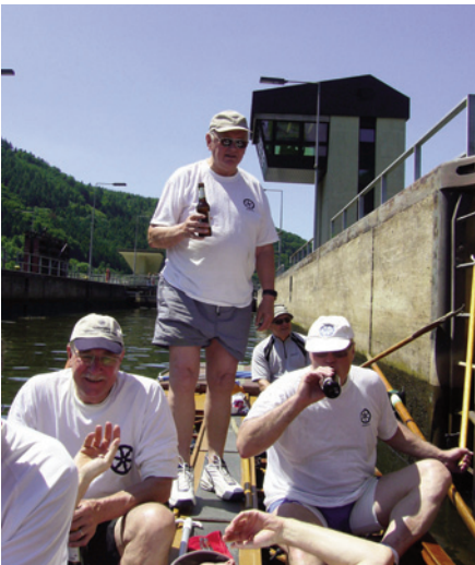
In einer Barke bieten die Schleusen, die an der Saar bis zu 15 m Höhenunterschied haben, wunderbare Erholungsmöglichkeiten.