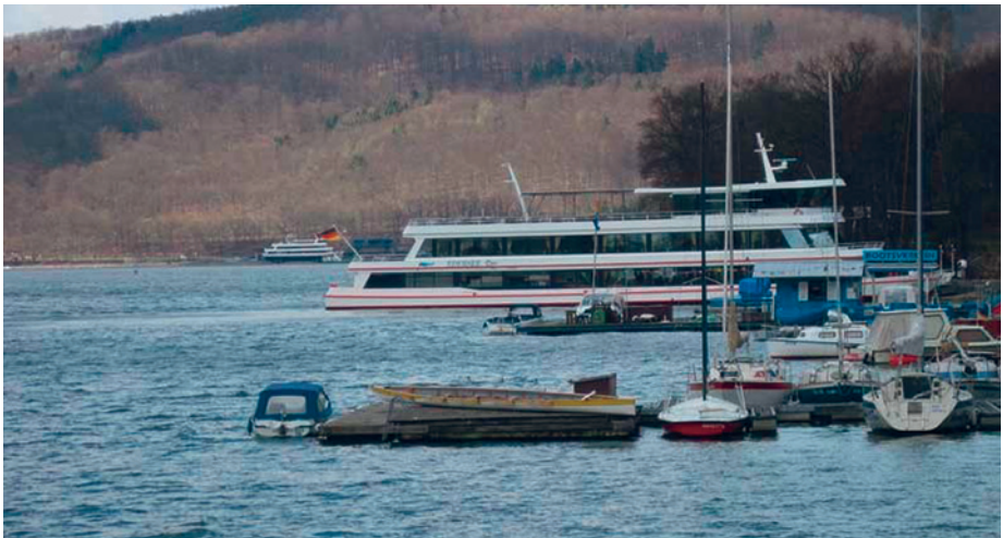
Impressionen vom Edersee im Frühjahr.

Nichtsdestotrotz konnten wir uns die Landschaft betrachten, die so zwischen Herbst und Frühling am Kämpfen ist, ent-