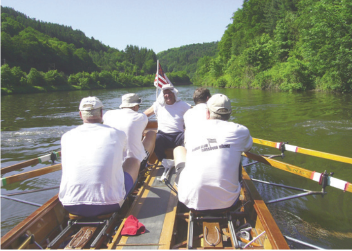
Die Saarschleife, herrliche Natur und ein Fluss, fast ohne Schifffahrt.