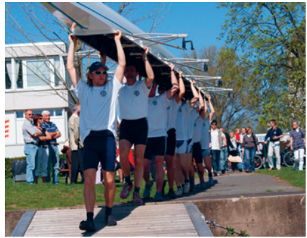
Der neue Achter auf dem Weg zur Jungfernfahrt.