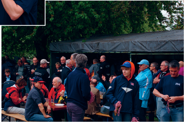
Warten auf die Siegerehrung.

Wie immer am 1. Mai fand auch in diesem Jahr die Langstreckenregatta auf dem Main zwischen Nied und Schwanheim statt. Hier einige Bilder.