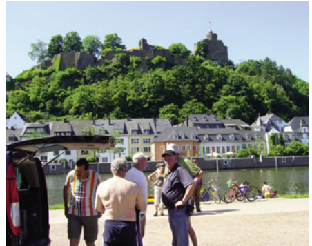
Drittes Etappenziel war die schöne Stadt Saarburg, mit einer der schönsten Burgen Deutschlands. Man sieht bei einigen der Ruderer schon einen deutlichen Muskelzuwachs.